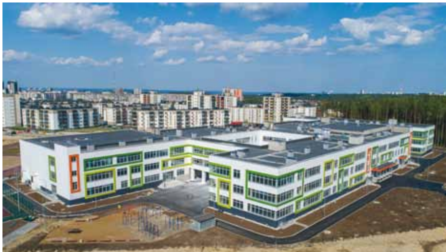
Школа на 1350 мест в Петрозаводске

ближайших планах. Чем бы мы ни занимались, но жилищное строительство было и остаётся приоритетным направлением, поэтому на протяжении последних лет мы регулярно становимся лидерами по вводу жилья в регионе.