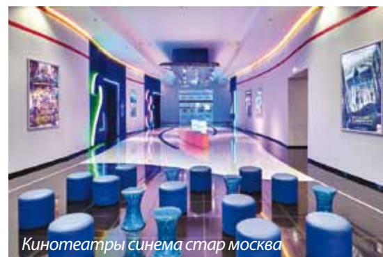
Кинотеатры синема стар москва

материалов, до готовых изделий непосредственно в процессе их изготовления по всей совокупности параметров. Оперативность контроля достигается благодаря наличию мини-лабораторий, расположенных на основных участках производства.