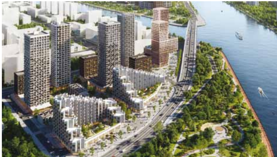
Жилой квартал Shagal от Группы «Эталон» стал победителем в номинации «Премьера года бизнес-класса №1»

ЖК «Новый Зеленоград» от IKON Development – победитель в номинации «Микрорайон Подмосковья №1». «Новый Зеленоград»