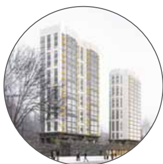
Жилой комплекс по ул. Речников вл. 18-20