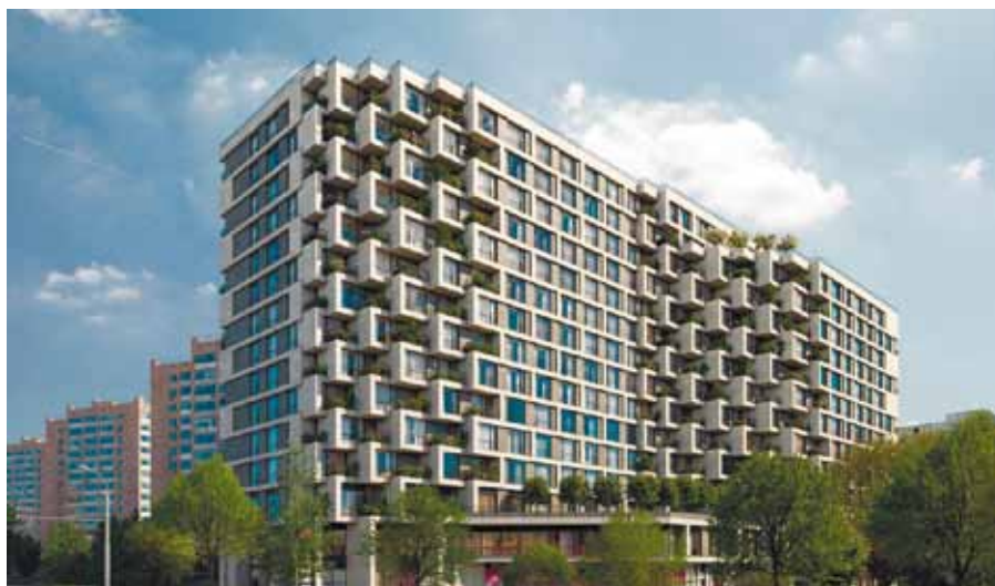
Комплекс апартamentов HILL8 от «Сити-XXI век».

Победителем в номинации Grand Prix стал комплекс апартamentов HILL8 от «Сити-XXI век». HILL8 – уникальное, современное 15-этажное здание, расположенное в 2 минутах ходьбы от станции метро «Алексеевская». В пешей доступности расположены парк Сокольники и ВДНХ. В здании предусмотрен двухуровневый подземный паркинг, из которого можно подняться на лифте на свой этаж. В облицовке первых трех этажей используется натуральный юрский камень. Здание спроектировано с применением современных BIM – технологий, позволяя эффективно управлять объектом. Комплекс апартamentов будет сертифицирован по мировому экологическому стандарту BREEAM на уровне «VERY GOOD».