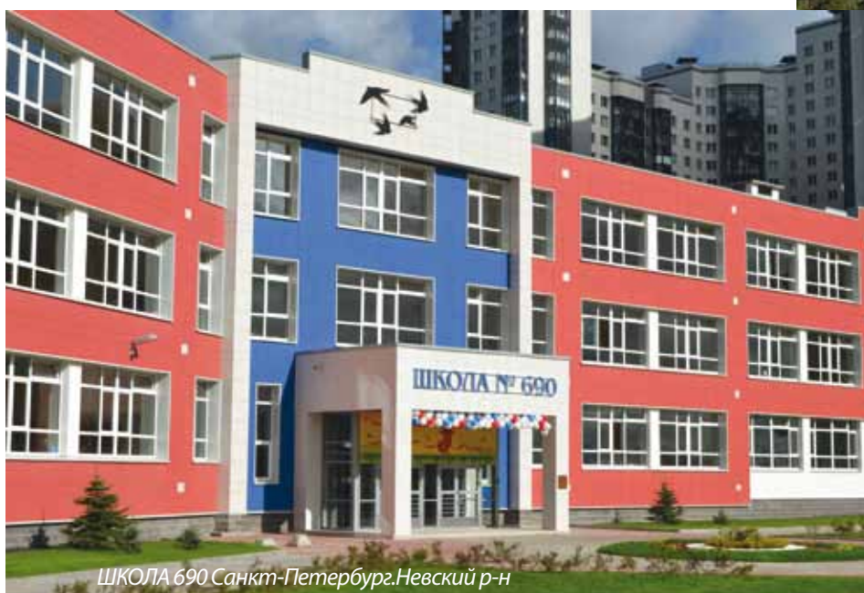
ШКОЛА 690 Санкт-Петербург. Невский р-н