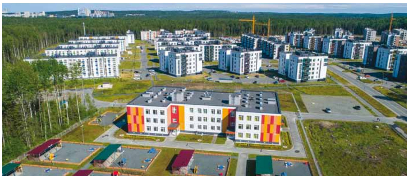
Жилые комплексы «Гармония», «Уютный», «Мелодия леса» и детский сад на 300 мест в Петрозаводске

Мы строим хорошее жильё – современное, комфортное, с продуманными планировками и интересными архитектурными решениями. Наши жилые комплексы занимают призовые места на различных специализированных конкурсах. Кроме того, с 2015 года мы построили 25 многоквартирных домов в рамках региональной программы по переселению граждан из аварийного жилья, строительство ещё нескольких домов в