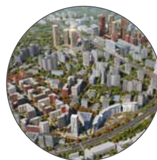
Жилой комплекс в районе Проспект Вернадского