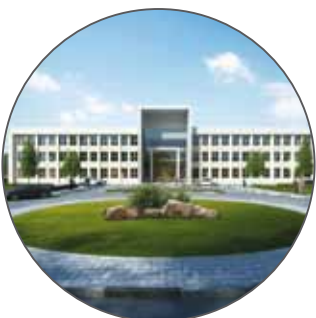
Грозненский международный университет