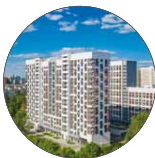
Жилые дома ул. Туристская вл. 14, корп. 1, 2.