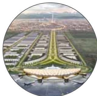
Международный терминал «АЭРОПОРТ ГРОЗНЫЙ»