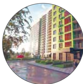
Жилой комплекс по ул. Лациса вл. 42