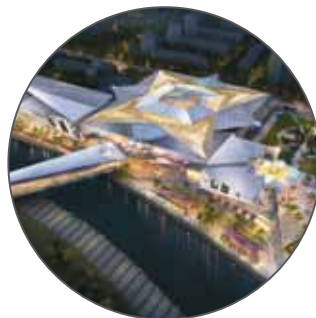
ТРЦ «ГРОЗНЫЙ МОЛЛ»