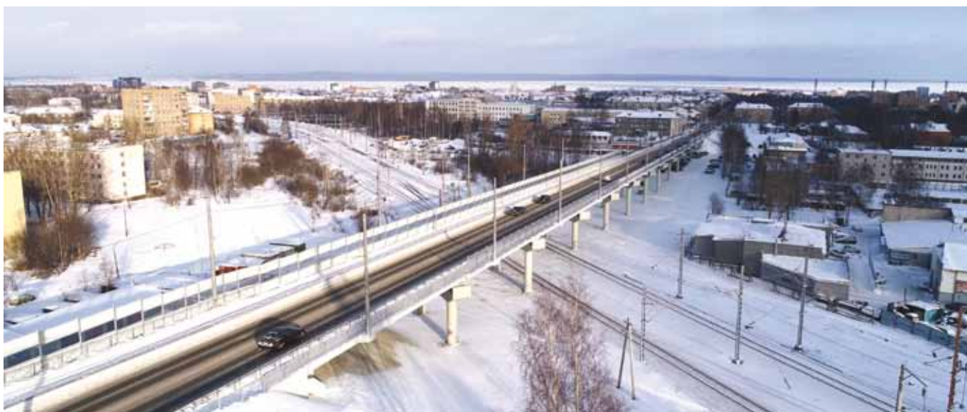
Путепровод в Петрозаводске

Пользуясь случаем хочу от всей души поздравить своих коллег – строителей с нашим профессиональным праздником! Совершенно замечательная у нас с вами профессия. Конечно, есть более высокооплачиваемые, более комфортные, но с точки зрения следа, который мы оставляем своим трудом, другой такой профессии, пожалуй, не найти.