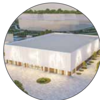
Республиканский центр спортивной борьбы им. Р.А. Кадырова