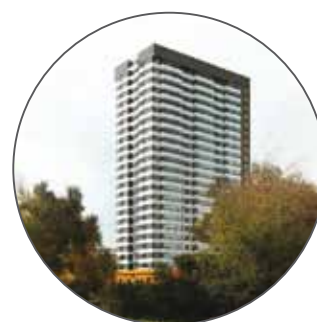
Жилой комплекс на Севастопольском проспекте вл. 7, корп. 6/1

установил не один рекорд. В октябре 2020 года проект ТРЦ «ГРОЗНЫЙ МОЛЛ» был удостоен победы в престижной премии «Arendator Awards 2020» в номинации «Лучший проект торгового центра», а также получил Сертификат в честь установления нового мирового рекорда – самого большого в мире архитектурного изображения восьмиконечной звезды.