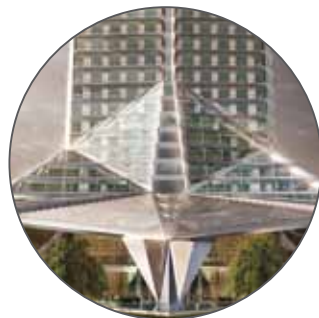
МФК «АХМАТ ТАУЭР»