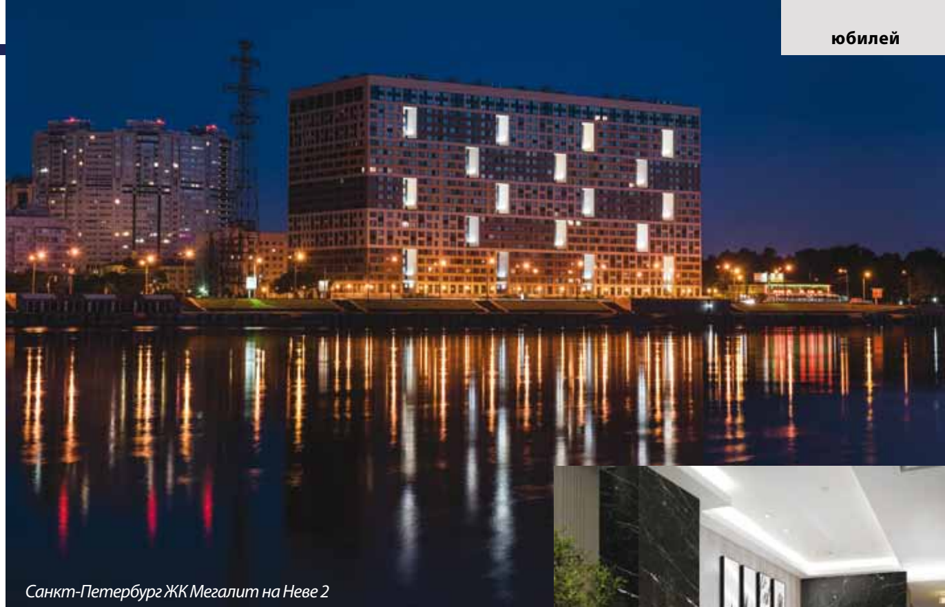
Санкт-Петербург ЖК Мегалит на Неве 2