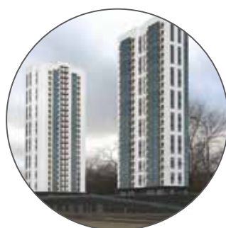
Жилой комплекс по ул. Речников вл. 22