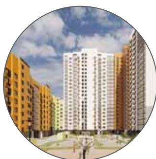
Жилой комплекс по ул. Кедрова вл. 16