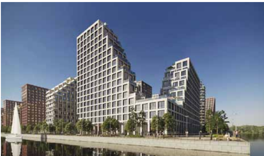
Городской квартал «Ривер Парк» – победитель в номинации «Хит продаж».

Московский Бизнес Клуб, организатор премии «Рекорды Рынка Недвижимости 2021», выражает благодарность всем участникам и партнерам.