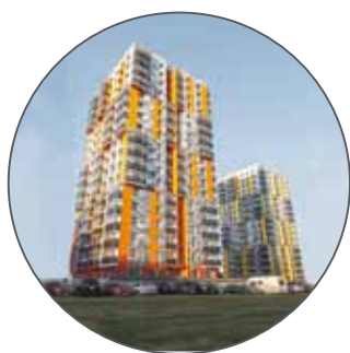
Построенные жилые дома в районе Котловка