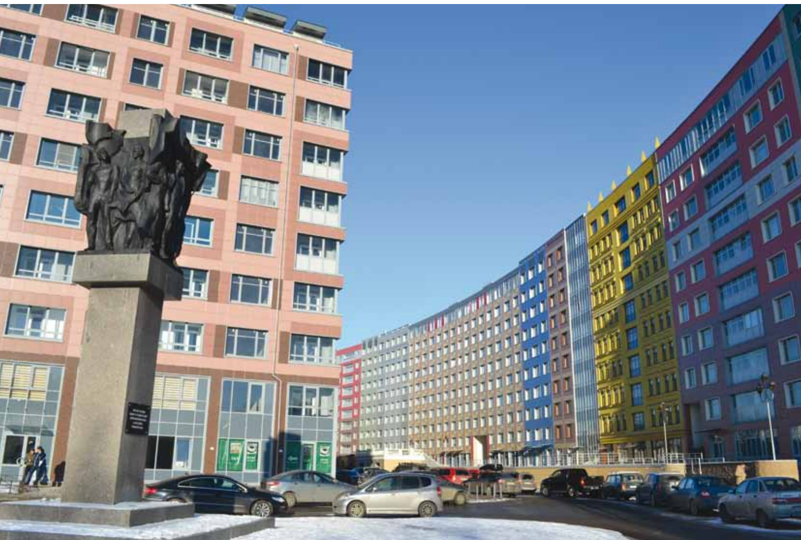
ЖК САМОЦВЕТЫ. Санкт-Петербург, ул. Уральская д 3,4

Снежинский завод керамических изделий (ООО «ЗКС»), входящий в состав группы компаний «Уральский гранит» в 2021 году отмечает свое двадцатилетие.